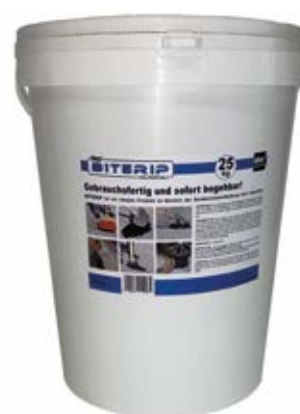
25 kg Eimer

Originalverpackt, kann das Produkt sechs Monate lang im Freien gestapelt werden, ohne seine Eigenschaften zu verlieren. Im Falle einer Aushärtung reicht es aus, es in der Nacht vor der Verwendung an einen warmen Ort zu stellen.